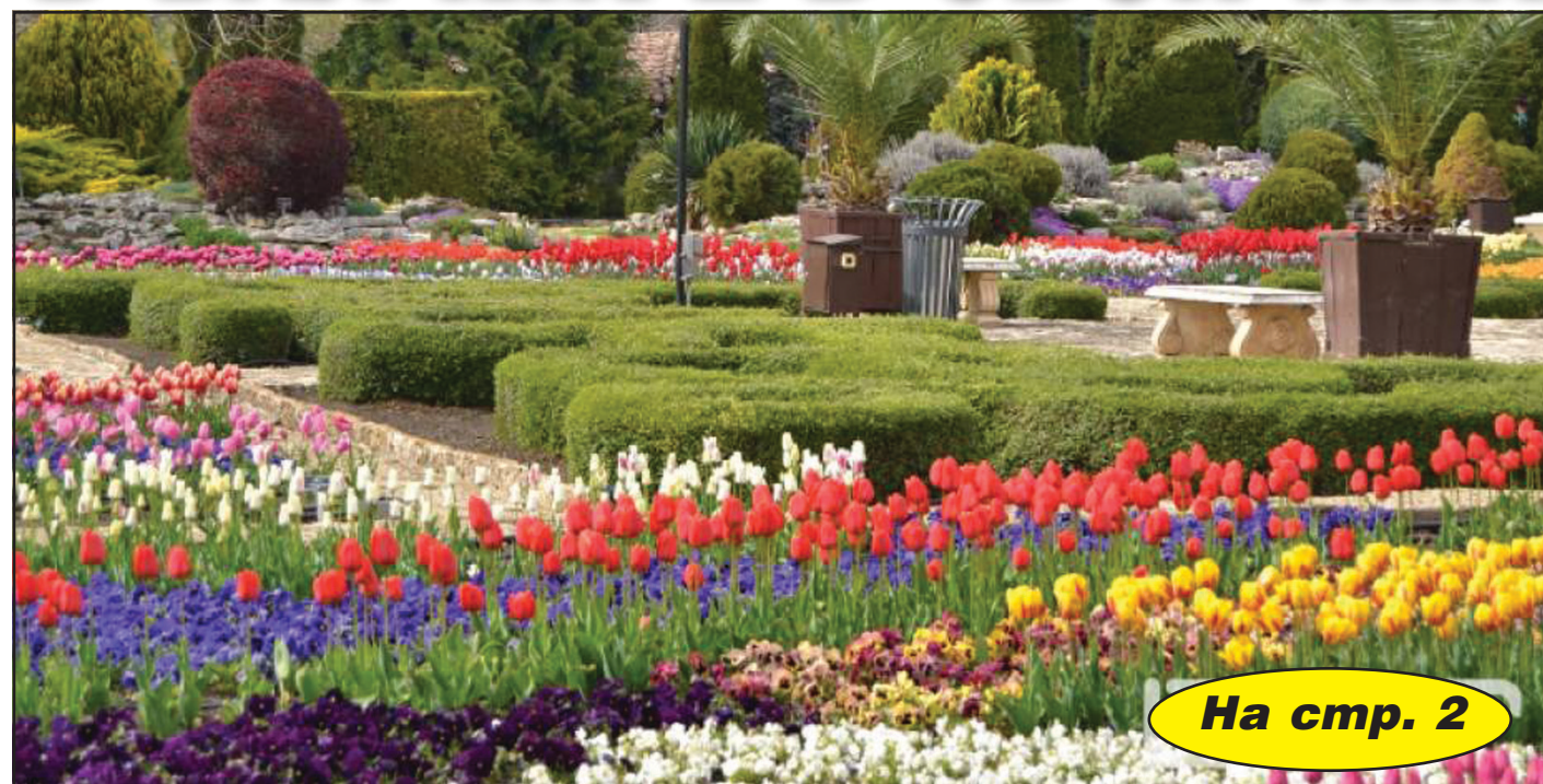
На стр. 2