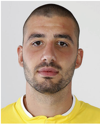
титлата при мъжете и на Държавното първенство в зала.

Припомняме, че само преди няколко дни той триумфира с