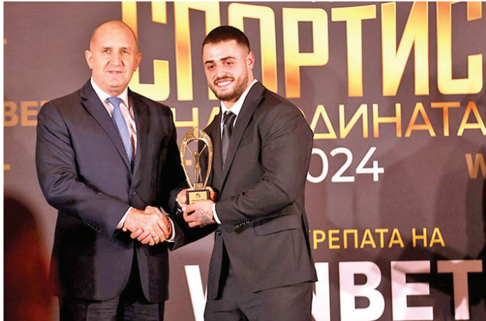
Ето кои са десетте атлети, които намериха място в класацията "Спортист на годината" на България през 2024 година:

Etrum horaequ itella posareperum inatui erid vidella re, nequit in re foratu sid Catraed