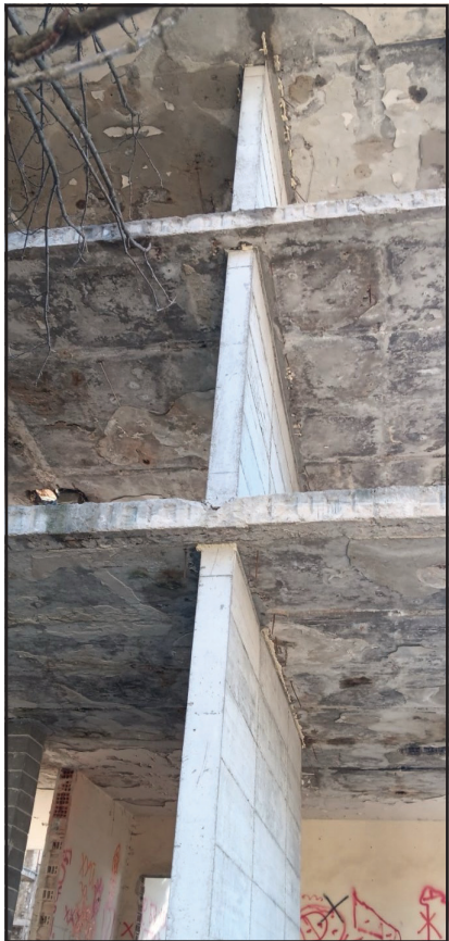
Изградени противоземетръсни шайби на сградата - бивш комитет

Инвестиционна активност на граждани, фирми и община: През изминалата 2024 година са издадени общо 65 броя разрешения за строеж. Дванадесет от тях са за пристройки, преустройства и складови помещения, свързани с бизнеса в земеделското и съпътстващите го услуги, шест са за фотоволтаични съоръжения (две за собствени нужди на фирми, четири за продажба на електроенергия), четири от издадените разрешения за строеж са за нови жилища на граждани, а 17 са за различни обекти на Община Тервел, за които са извършвани основни ремонти или са се изграждали нови обекти. Издадени са общо 23 удостоверения за въвеждане в експлоатация на ремонтирани или построени обекти, 5 бр. са за пристройки и гараж и 15 бр. са за общински обекти. Извършени са 11 бр. изменения на подробни устройствени планове, като 4 от тях са за реализиране на инвестиционни намерения - 3 в гр.Тервел и 1 в с.Жегларци. Преобладаващата част от инвестиционните намерения са завършени и въведени в експлоатация също през миналата година.