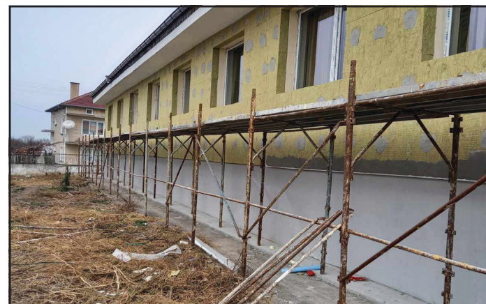
Санитарне на дома за стари хора

за 2024 г., в т.ч. и трансформираните средства за текущи ремонти, възлиза на 1 832 х.лв.