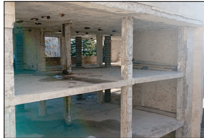
Почистена и подготвена за работа конструкция на сградата - общински жилища

през 2025 г., 4. Нови носии за ансамбъла - изпълнен проект, финансиране чрез МИГ; Проектите, които са финансирани чрез капиталовата субсидия на Община Тервел са следните: основни ремонти на покривите на общинска администрация Тервел (обособена част), медицински център Тервел, ремонтна работилница Тервел, конструктивно укрепване на комплекс Българка, конструктивно укрепване на читалищна сграда с.Орляк, основни ремонти на улици в селата Сърнец, Попгруево, Божан, Зърнево, Нова Камена, изграждане на площадка за скейтборд в парка