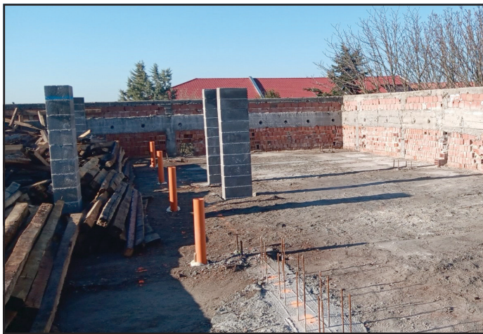
Покрив на сградата на комитетата

и пътно платно за новообразуван квартал до болничната сграда в Тервел и този, който е продължение на ул.„Братя Миладинови“, в Тервел - избран изпълнител, организира се из-