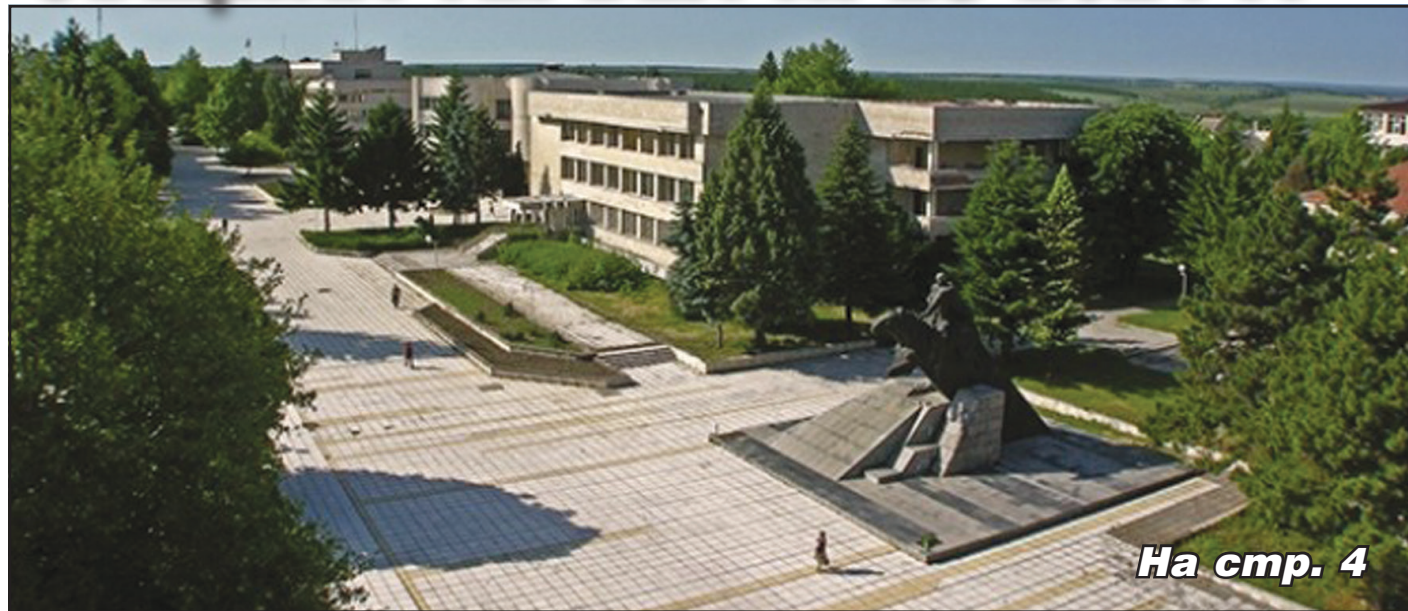
На стр. 4

Над по-голямата част от страната ще преобладава слънчево време с разкъсана средна и висока облачност. Преди обяд на много места в равнините и котловините ще е мъгливо, като около обяд в повечето райони. В Източна България и северно от планините ще духа до умерен юг-югозападен вятър. Максималните температури ще бъдат между 13° и 18°