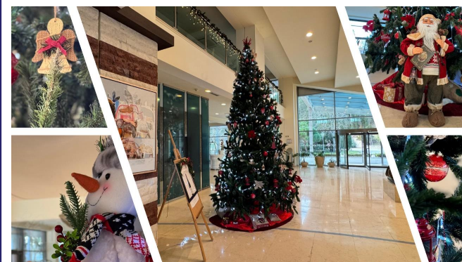
Тази Коледна си подарете вълшебна почивка край морето в хотел Фламинго Гранд & СПА 5* в Албена!