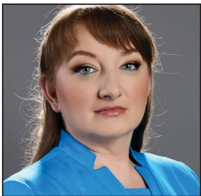
Деница САЧЕВА ГЕРБ-СДС