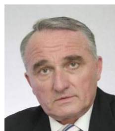
Проф. Евгени Сачев

„Изграждане и управление на корпоративен имидж и репутация“