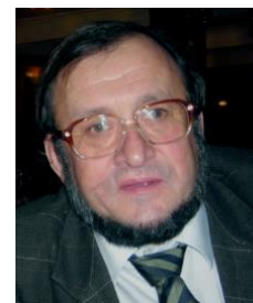
Проф. Милко Петров

„Изграждане и управление на корпоративен имидж и репутация“