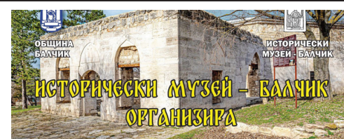
ХІ ФОЛКЛОРЕН СЪБОР, СВ. АТАНАСИЙ

Фолклорният събор започва в 10 часа на 18 май 2024 г. ВХОД СВОБОДЕН