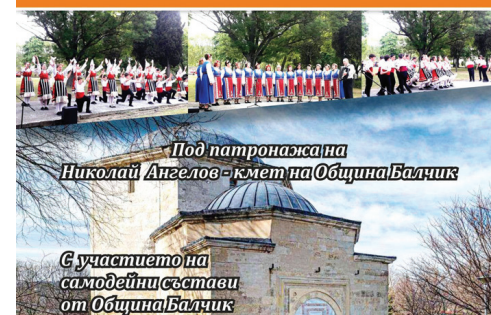
Под патронажа на Николай Ангелов - кмет на Община Балчик