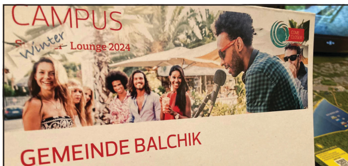
от летището до всеки хотел. Специален акцент на шанда

Продължава участието на Община Балчик в туристическия кампус, организиран от големия оператор ДЕР Туристик Германия. Прудставители на повече от двеста фирми от градовете Кьолн и Есен се запознаха през последните два дни с условията за отпих и развлечения в региона на Балчик. Повече от туроператорите имат опит с българските курорти, но на шанда на Общината получиха информация за новите обекти за спа и рекреационен туризъм, голф игрищата, богатата културна програма и възможността за бърз трансфер