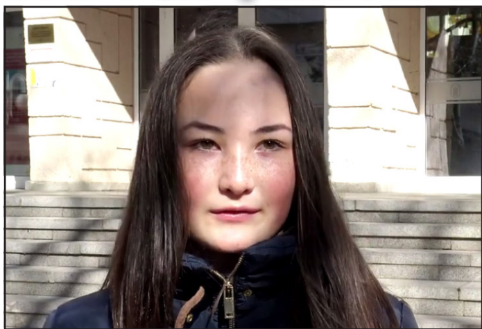
Отличените спортисти бяха наградени на заседание на Общинския съвет в Добрич от