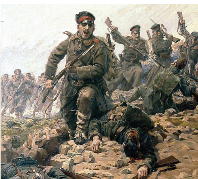
години Балкански войни... Спечелилите проекти ще бъдат популяризирани чрез отразяване от трите военни медии. Информация за конкурса:20231003_Nacionalen_uch_konkurs_110g_BV.pdf (mod.bg) Д о п ъ л н и т е л н а информация:Военно окръжие II степен - Добрич тел. 0882 552 019, 058 664764

нописни страници и до 4000 знака, а текстът на всяка страница да не надхвърля 30 реда, при големина на буквите 14, шрифт Times New Roman, полета 2/2/2/2 в разстояние между редовете single. Проектите могат да се подават на e-mail:ovo_dobrich@abv.bg в срок до 31.01.2024 г. Оценяването ще се осъществи от областна комисия, включваща началник/представител на Регионално управление по образованието - Добрич, началник/представител на Военно окръжие □□ степен-Добрич, председател на областната организация на Съюза на ветераните от войните на България в срок до 16.02.2024 г. Награждаването на регионално ниво на спечелилите първо, второ и трето място проекти в двете възрастови групи ще се проведе по повод 1 ноември - Ден на народните будители. Спечелилите първо място в двете възрастови групи ще бъдат изпратени от Военно окръжие □□ степен-Добрич до Министерство на отбраната. Оценяването ще се осъществи от комисия, включваща представители от Министерство на отбраната, Националния военноисторически музей, Военна академия „Г.С.Раковски“, Централно военно окръжие, Централния управителен съвет на Съюза на ветераните от войните на България и РУО - София в срок до 29.02.2024 г. Резултатите от конкурса ще бъдат обявени на сайта на Министерство на отбраната www.mod.bg в рубриката „110