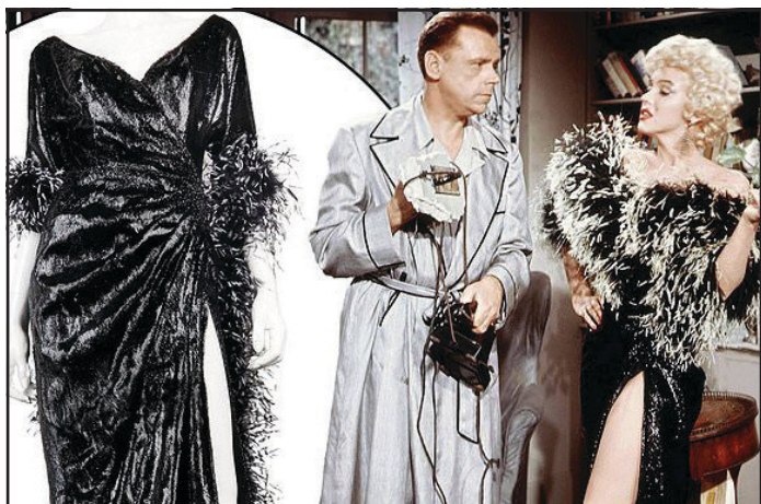
декемврийския брой на списание Life от 1958 г.

Един от другите тоалети на Монро, които се предлагат на търг, е сатенено лавандулово трико, което тя носи за снимка в