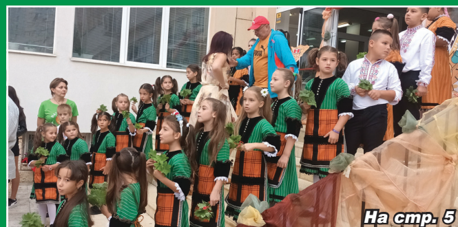
На стр. 5