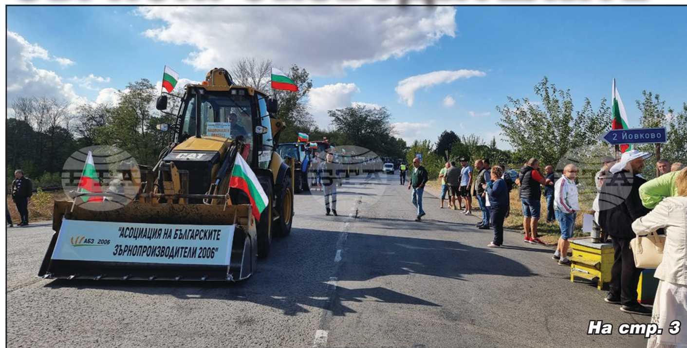
На стр. 3