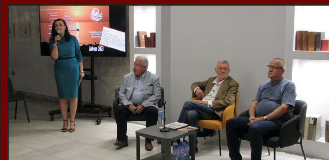
На стр. 4

Ще бъде предимно слънчево. След обяд над Западна България ще има временни увеличения на облачността, но ще е почти без валежи. В Източна България ще духа слаб до умерен вятър с източна компонента. Максималните температури ще са между 24 и 29. По Черноморието ще бъде предимно слънчево. Ще духа слаб до умерен вятър от югоизток. Максималните температури ще са 23-25.