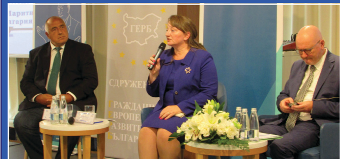
На стр. 4