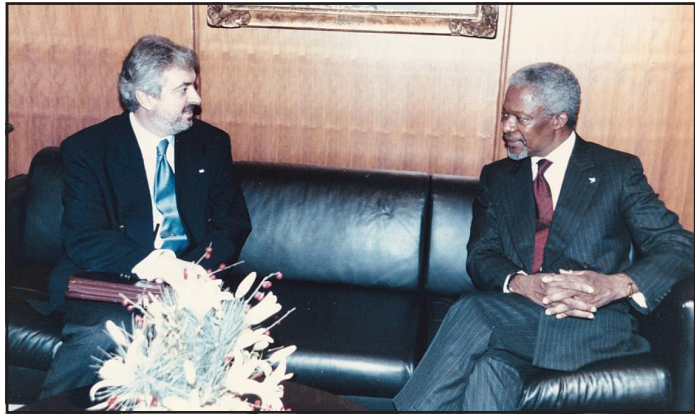
С Кофи Анан, ген. секретар на ООН през 1999г. се вижда.

Кръвта, насилието, правото на Силата над силата на Правото определят правилата на тази кошмарна игра, чийто край не