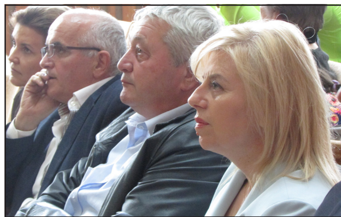
- 1941 г., в село Черна пробуди искрена завист и навя скъпи спомени в по-възрастната публика, израсла сред овце