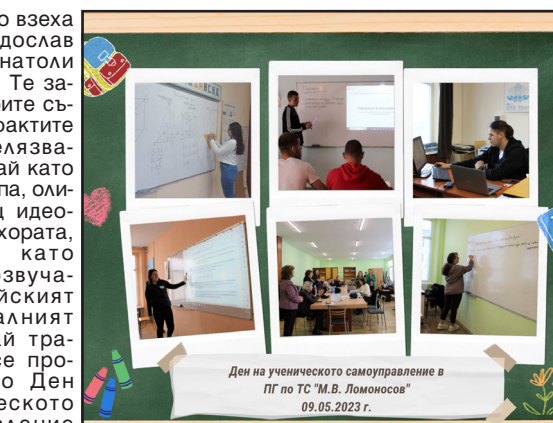
Ден на ученическото самоуправление в ПГ по ТС "М.В. Ломоносов" 09.05.2023 г.