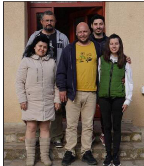
В село Красен се проведе шестото издание на Национален фотопленер "Пролетни хоризонти," организиран от Община Генерал Тошево и кметство село Красен.

бъдат заснети, съхранени и публично презентирани природните и културни забележителности на района. Събитието е част от културната стратегия на Община Генерал Тошево, насочена към открит диалог и партниране с дейци, институти и творчески организации в сферата на фотографията.