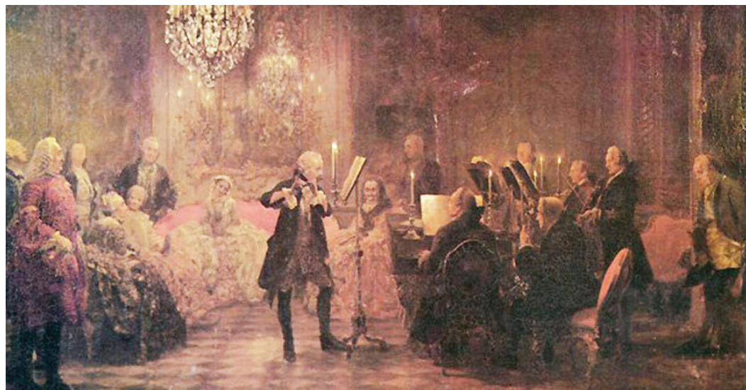
Крал Фридрих II Велики изпълнява концерт за флейта в замък Сан Суси, на клавирина от Карл Филип Емануел Бах / фрагмент от маслено платно на Адолф фон Менцер, 1852 г. /

Билети от 16.30 ч. в залата - 5 лв., за пенсионери и учаци - 2 лв