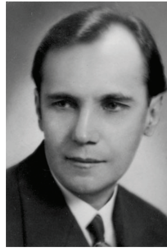
на Златаров са и областите, в които той реализира научни постижения.

майка си – жена с културни интереси – момчето научава руски и френски език. Още юноша чете в оригинал руските революционни демократи и френските поети. Асен учи гимназия в Пловдив, завършва в София и става студент по химия в Софийския университет. По-късно следва в Женева... След защита на доктората си в Греноблиякския университет, младият човек се отдава на научна и преподавателска работа в България – първоначално като учител в Пловдивската гимназия, а след това като асистент, доцент и професор по химия в Софийския университет. Златаровата биография за периода 1905-1937 година сочи 660 заглавия на научни трудове, учебници, научнопопулярни материали, литературни и литературно-критически статии и есета. Доказателство за огромната научна дейност