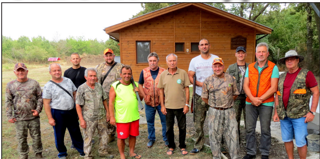
На 27 август 2022 г. на ловно-стрелковия комплекс на сдружение „ЛРД Добрич“, - гр.