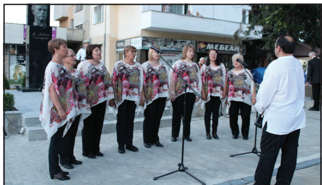
Църковният хор пее за Левски