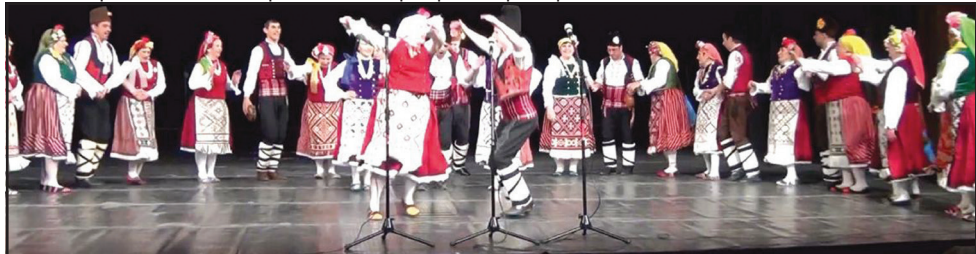
Читалището в Тервел - копие от онлан конкурса Заедно в 21-ви век