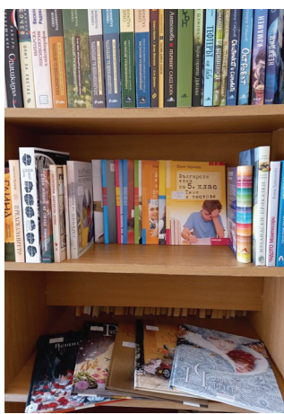
Част от новите книги в библиотеката

През 2021 г. всички читалища участваха във Фестивал на бя-