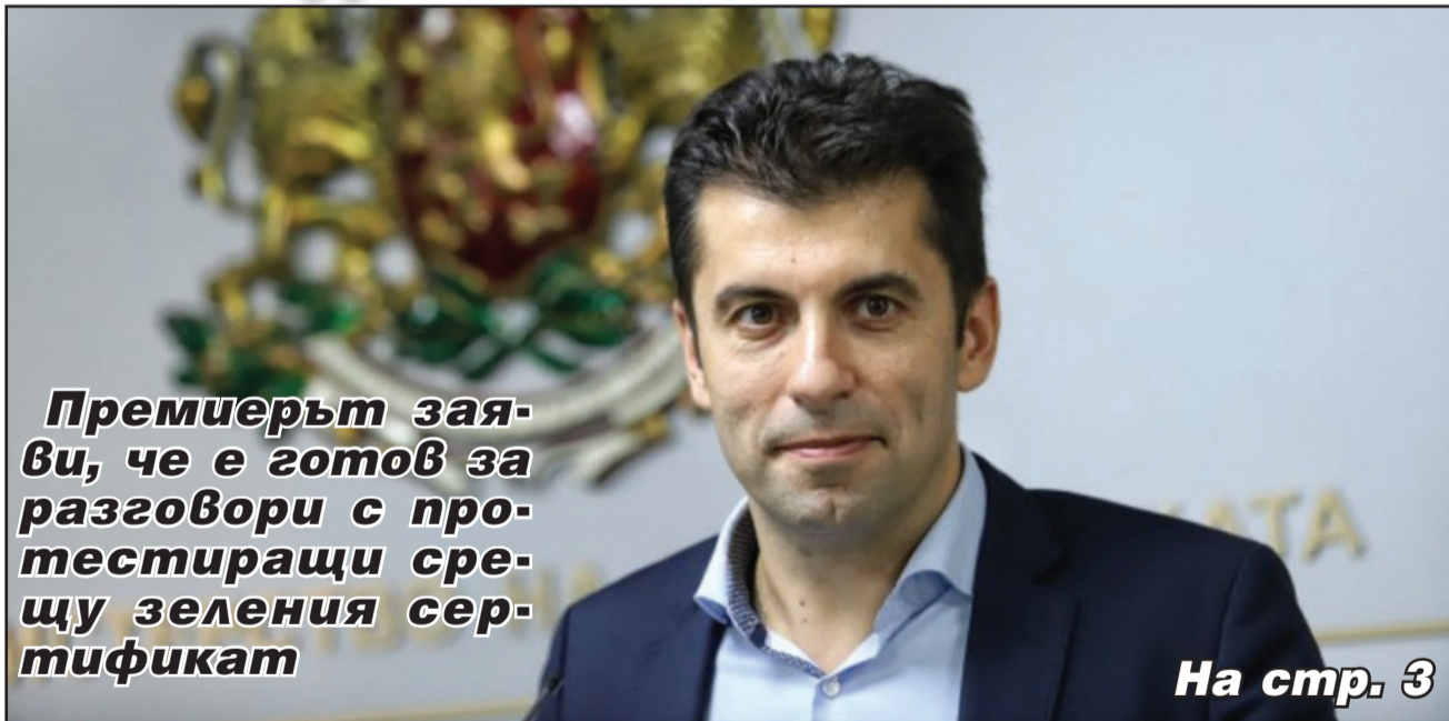
Премьерът заяви, че е готов за разговори с протестиращи срещу зеления сертификат