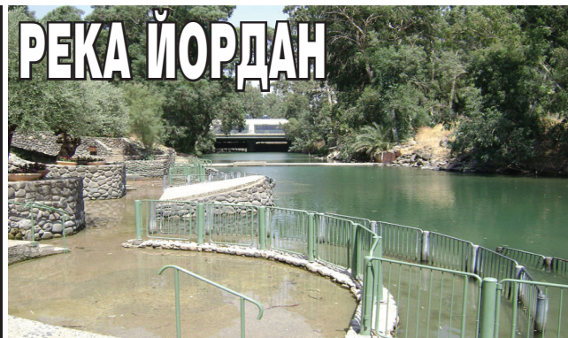
Йордан е река в Западна Азия, която тече през долина и се влива в Мъртво море. Води началото си от изворите в подножието на планината Ермон. В частта си северно от Галилейско море реката е в границите на Израел. Южно от езерото тя служи за граница между Йордания и Израел, а след това между Йордания и Западна бряг.

Тя протича още през териториите на Ливан и Йордания. Дължината ѝ е 252 км.