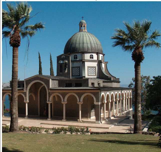
Храмът на брега на езерото Тинерет, където днес милиони туристи се срещат с 10-те божи заповеди

дото следващата женска риба, която ще бъде оплодена. Повече от седем дни може да издържи женската галилейска риба без да се храни. Това е наложително, тъй като все пак тя трябва да отгледа бъдещето поколение. В Египет съществуват стенописи от XV в. пр. Хр. (времето на кралиците Хатшепсут и Аменхотеп II), на който може да се види нарисувана тилапия като тотемно животно, плаващо в специален басейн. Малкит героизъм на женската тилапия дотогава впечатлила древните египтяни, че те й посветили йероглиф. Върху съдове и древни фрески можело да се види галилейската риба с лотос в уста, символизиращ възкресението и новия живот след смъртта.