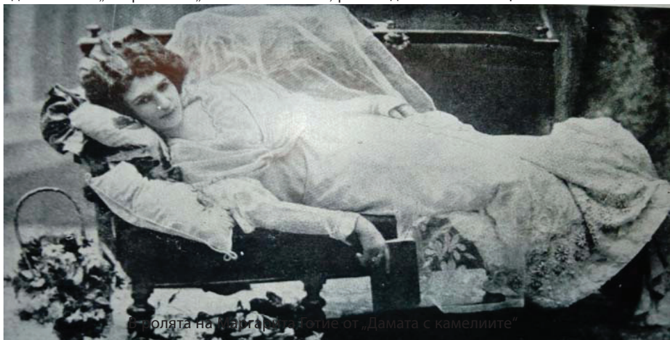
ролята на Елени от „Дамата с камелиите“

до 23 декември, 11.30 ч. – 17.30 ч., Младежки център – Добрич. Благотворителна инициатива „Коледно вълшебно сътвори...“ II в подкрепа на кампанията „Споделяне хляб“, на Фондация „Милостиво сърце...“ Организатор: Младежки център – Добрич. НДТ