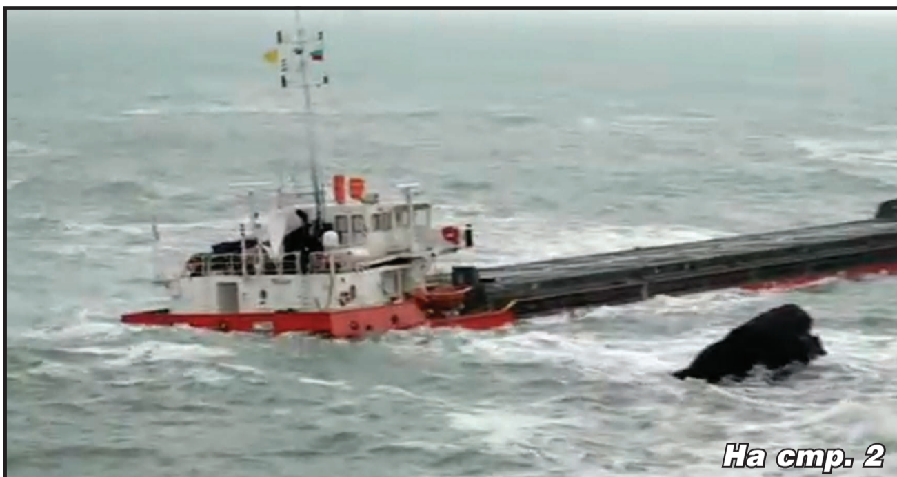
На стр. 2