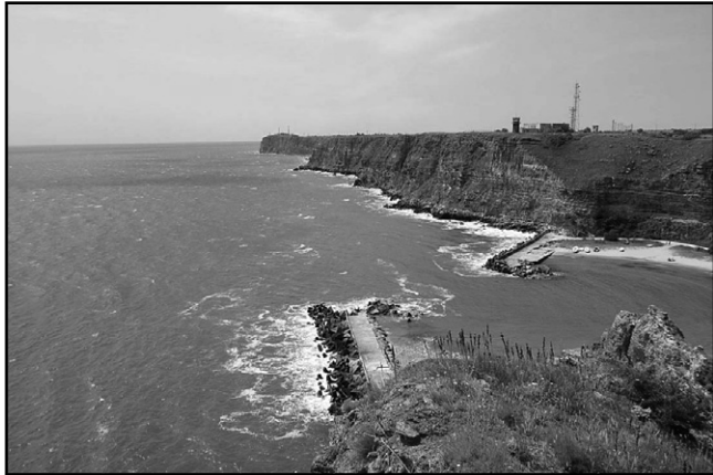
камуфлажен каяк. След крайбрежната ивица. Рибари от Шабла също търсеха