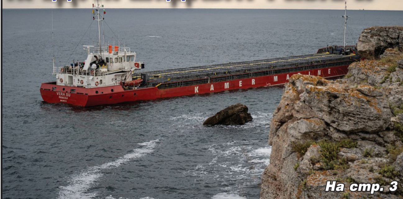
На стр. 3