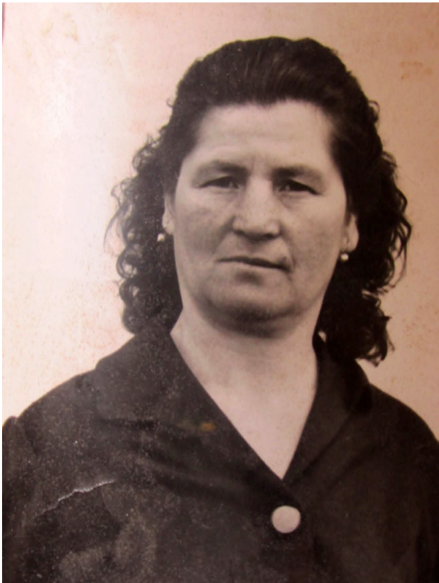
Наградена с екскурзия от ТКЗС.....