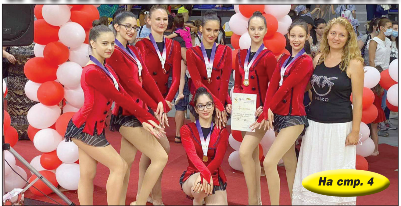
На стр. 4