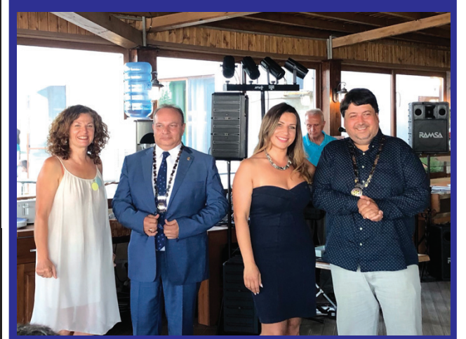
На стр. 6