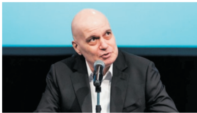
Николай Василев е участвал в управлението на България в 2 правителства. Говори 7 езика. На 51 г.

Повече информация и достъп до базата от данни има в интернет страницата на проекта: http://valorizenfil.eu и https://database.valorizenfil.eu