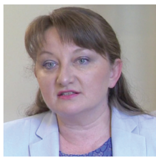
Деница Сачева ГЕРБ-СДС