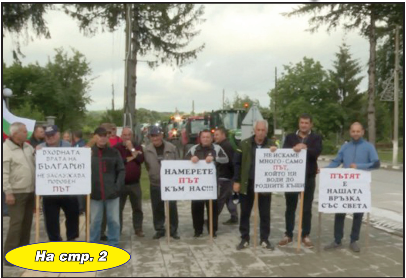
На стр. 2