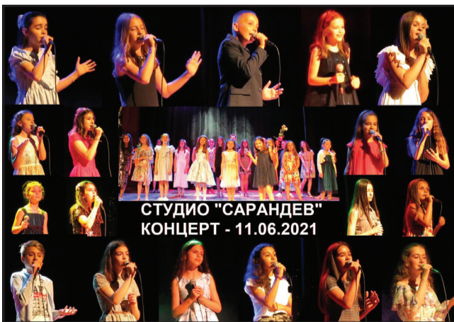
СТУДИО "САРАНДЕВ" КОНЦЕРТ - 11.06.2021

Следващият концерт на Студио „Сарандев“, в който ще се