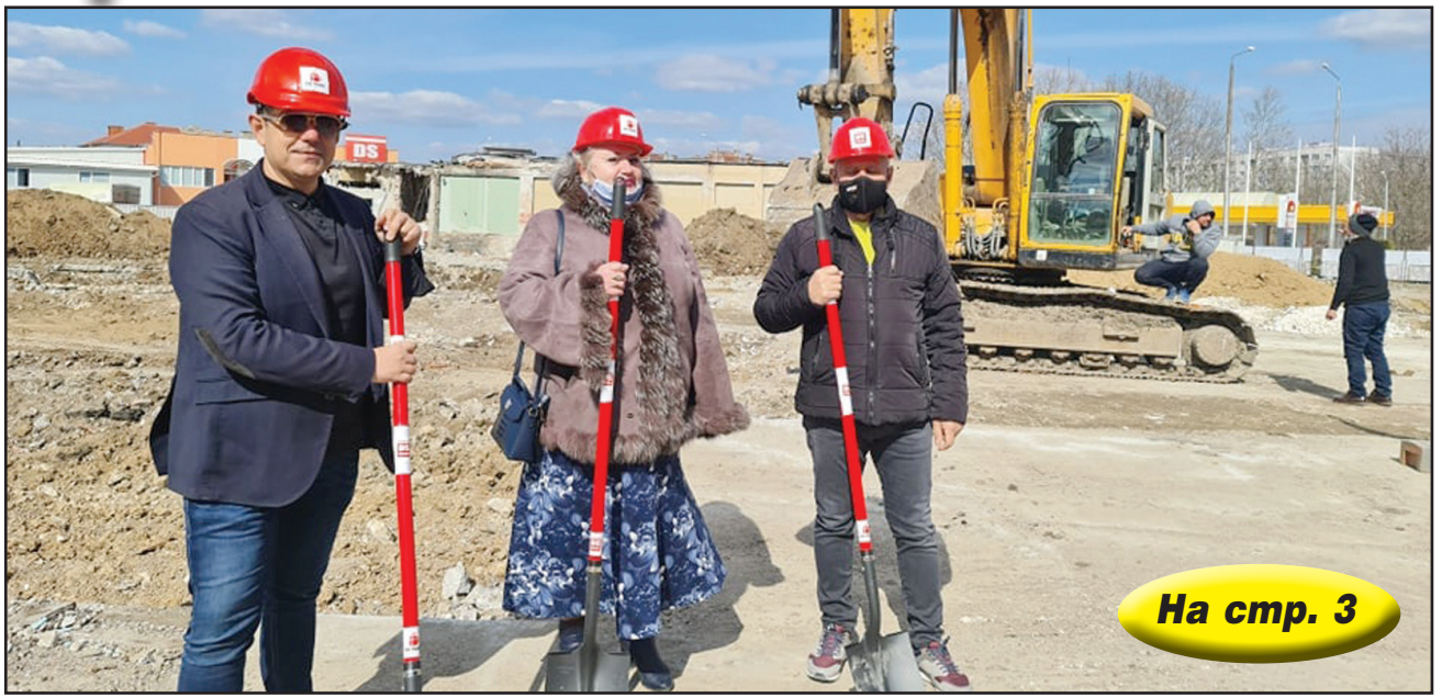
На стр. 3