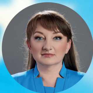
ДЕНИЦА САЧЕВА социални дейности