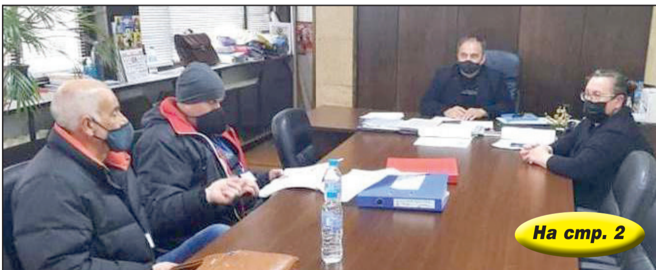
На стр. 2

ДВЕ ОТ ЖЕРТВИТЕ НА ТЕЖКАТА КАТАСТРОФА ПО ПЪТЯ СОФИЯ - ВАРНА, СА ОТ ДОБРИЧ Две от трите жертви на свирепата катастрофа вчера по пътя София - Варна, са от Добрич, стана ясно от информация на ОД на МВР Велико Търново. Тежкия инцидент е станал около полунощ край великотърновското село Козаревец. Автобус на транспортна фирма, пътуващ по линия София - Варна, се сблъсква с тежкотоварен автомобил „Волво“, на добричката фирма ПАТО, който е превозвал бутилки с безалкохолни напитки от Варна за София. На място са загинали са трима души - шофьорът на автобуса, на 45 години, 53-годишен пътник от автобуса, който седял зад шофьора, и шофьорът на тира, на 51 години. Последните двама са от Добрич. В автобуса е имало 7 пътници, предимно студенти. Четирима от тях са пострадали и са отведени във Великотърновската болница. Състоянието им е стабилно. Касетките с бутилките от товарния автомобил буквално са се изсипали върху стъклата на автобуса и довели до нараняванията. Пътят е бил затворен над 6 часа. Трагичният инцидент е станал на мокър пътен участък, при обилен валеж, примесен със сняг. Ударът бил челен. От силата касите се изсипали в автобуса. На местопроизшествието е извършен оглед. Причините са в процес на изясняване. По случая е започнато досъдебно производство. НДТ