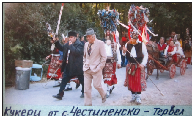
Кукери от с. Честименско - Тервел

по-ново време освен кукерските игри се появяват и нов тип народни театрални представления. Често те отразяват съществуващата действителност. Така на този ден сред маскираните лица могат да се срещнат свещеник, младоженци, циганин, мечка и