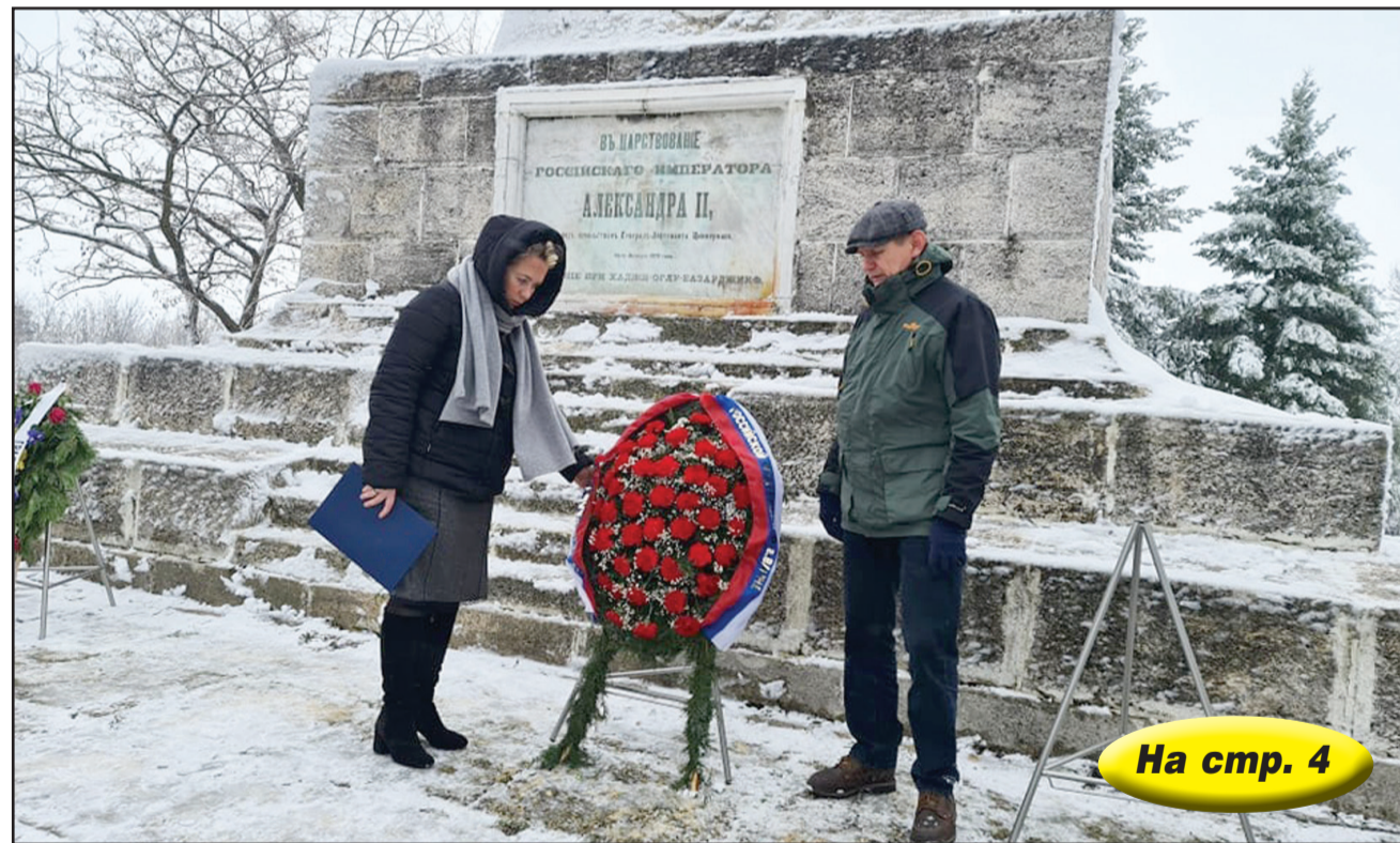
На стр. 4