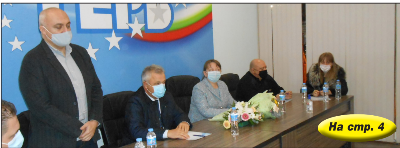
На стр. 4