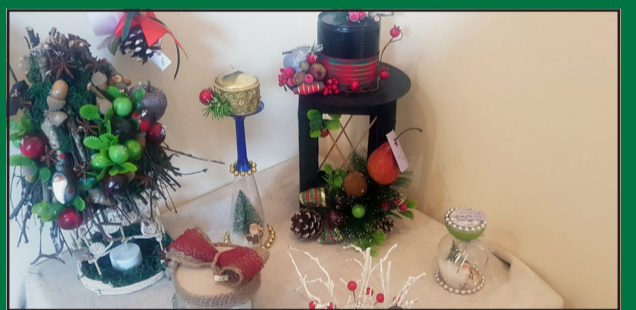
На стр. 3