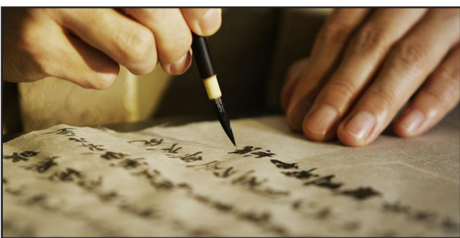
Йероглифът със значение „тясно“, или „близо“, е избран като символ на отиващата си 2020 г. в Япония.

Това съобщи Японската федерация за тестване на йероглифични умения, която е провела гласуване сред населението на страната.