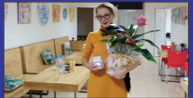
На стр. 4