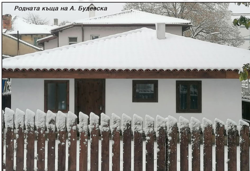
Родната къща на А. Будевска

При все че в Добрич Будевска живее изключително малко време, в сърцето си тя пази специално място за града