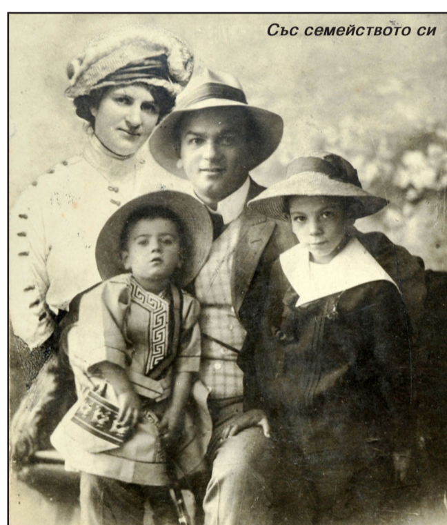
Със семейството си