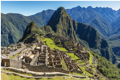
Мачу Пикчу, древният високотпланински град в Андите е

отворен отново след близо осем месеца затваряне заради пандемията от коронавируса.