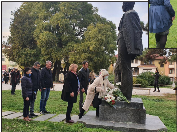
ли на политически партии и граждани

на Добрич поднесоха цветя на паметника на Йордан Йовков и засадиха американски червен дъб на Алеята на именитите личности, свързани с Добрич и Добруджа.