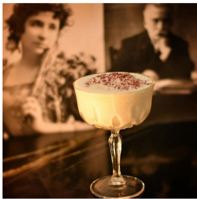
лебед, използвана в операта на Вагнер „Лоенгрин“, в която играе Мелба.

Мелба Нели Мичъл е сопрано, което не се радва на особен успех в Мелбърн и затова тя опитва късмета си в Европа. Там става изключително успешна и известна като "Нели от Мелбърн" и оттам - Нели Мелба. Един от най-известните готвачи на всички времена е французинът Огюст Ескофие, измисля десерта през 1892 г. и го кръщава на нея. Праскови, малинов сироп и ванилов сладолед! За да е сигурен, че всички са видели неговото изобретение, както и че всички знаят, че мелбата с праскови е за оперната певица, той го излага заедно с огромна ледена скулптура на