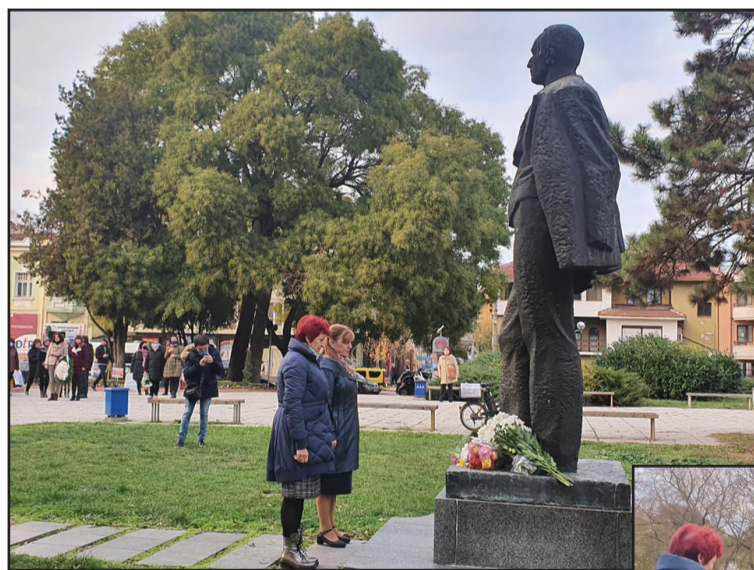
Кметският екип на Добрич, общински съветници, представители на политически партии и граждани