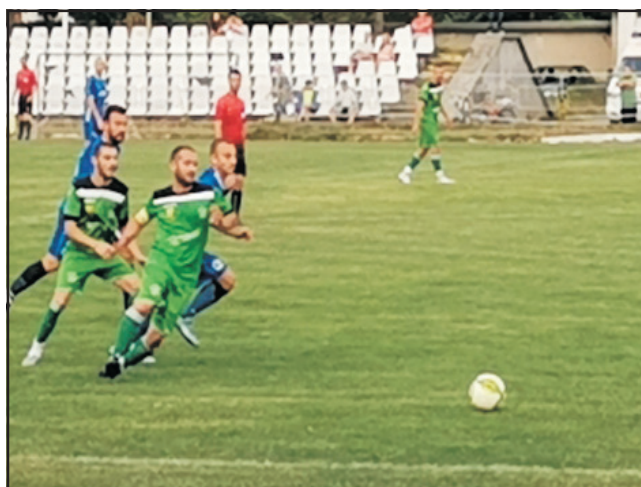
В следващия кръг Интер (Добрич) гостува на Шумен 2007, докато Устрем (Дончево) приема другия новак в групата Спортист (Генерал Тошево).