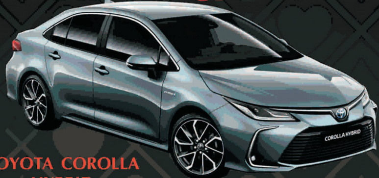
TOYOTA COROLLA HYBRID