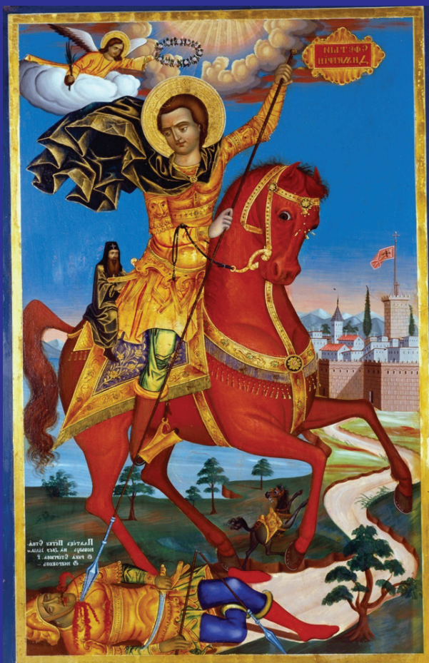
На стр. 6