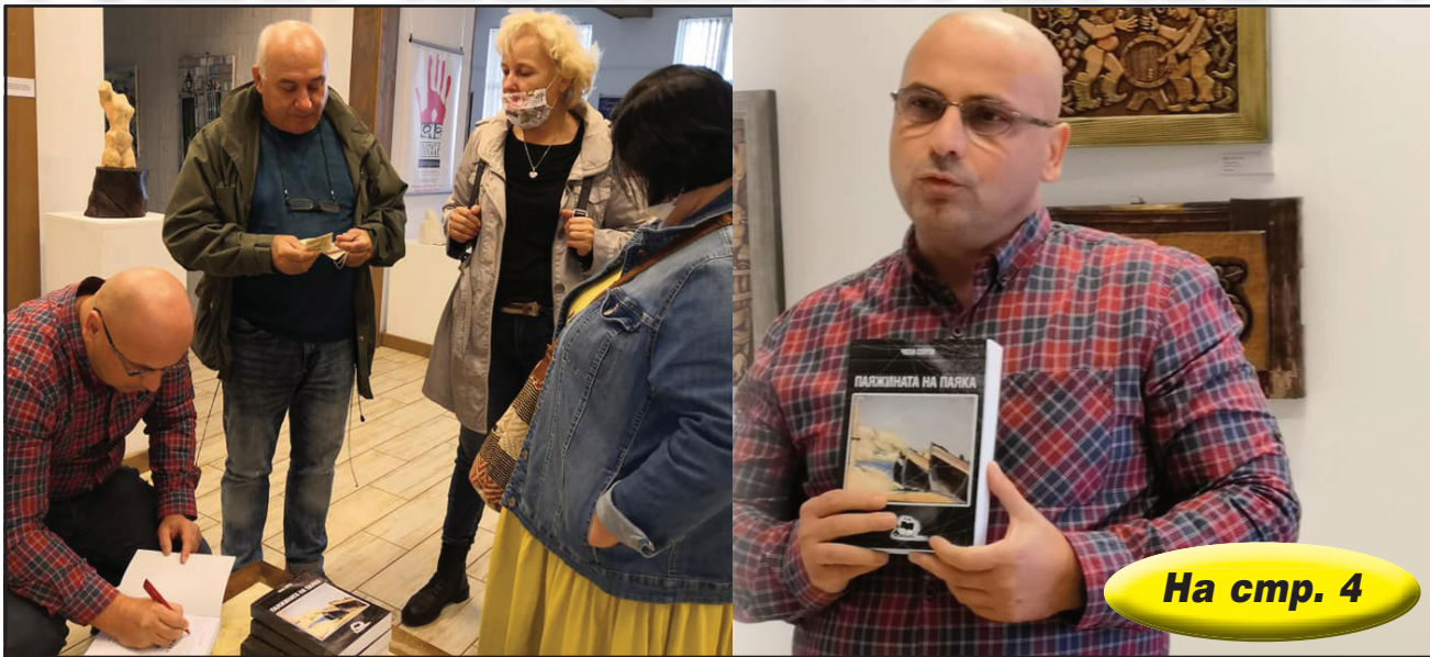
На стр. 4