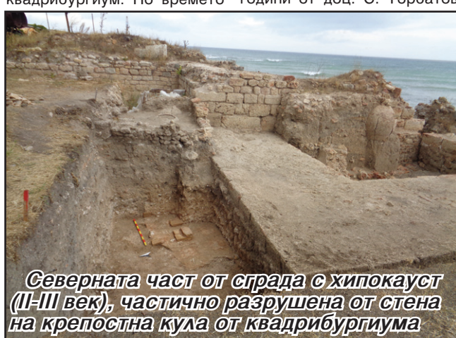
Северната част от сграда с хипокауст (II-III век), частично разрушена от стена на крепостна кула от квадрибургиума

копките бяха финансирани от Министерството на културата на Република България и бяха успешно завършени благодарение на логистичната подкрепа на община Шабла.