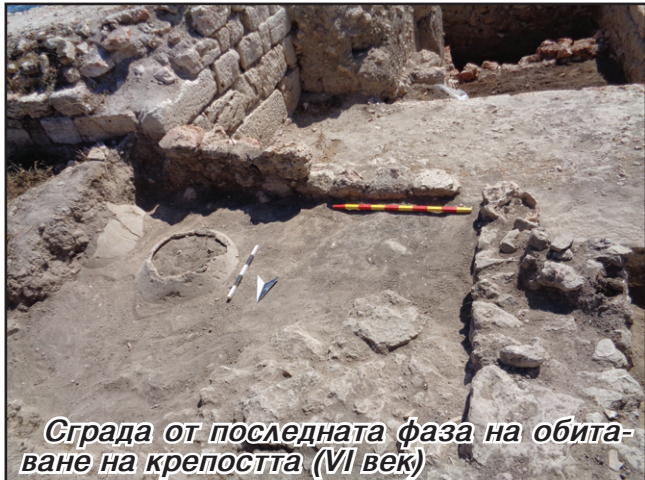
Сграда от последната фаза на обитаване на крепостта (VI век)

на Дионисопол и Амфиполис. Едва по-късно, възстановеното върху развалините на крепостта поселение е унищожено от аварите. С този последен етап от неговото съществуване можем да свържем разкритата преди години от доц. С. Торбатов