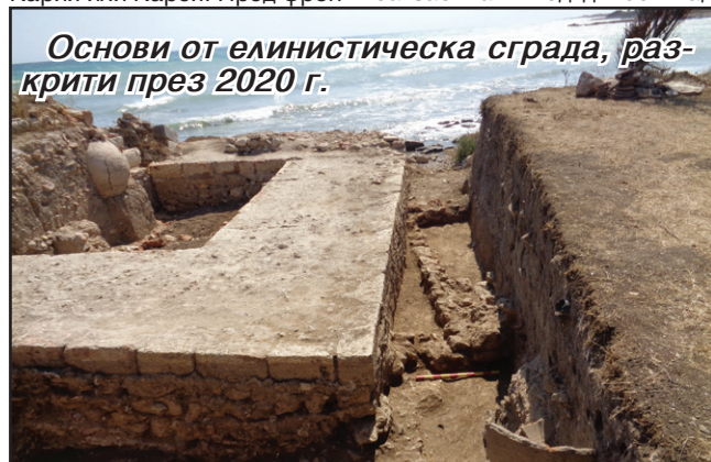
Основи от елинистическа сграда, разкрити през 2020 г.

С цел по-добро консервиране и запазване на основите от крепостни стени и питосите, разкритите съоръжения бяха зазимени. В очакване на бъдещ проект за реставрация, останките от елинистическите градежи са засипани под дълбок над