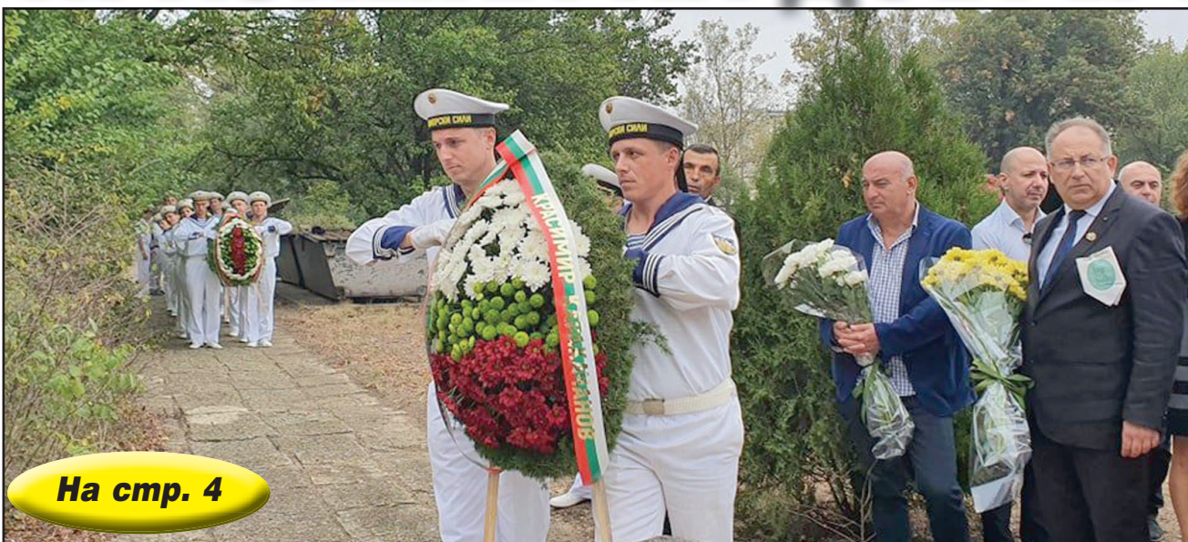
На стр. 4