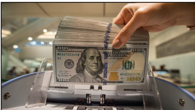
Аризона - данък лед често се покачат над 31,7 по Температурите в Аризона Целзий. Така че ледът е скъпо

нещо в Аризона. За щастие кубчетата лед са освободени от данък върху продажбите, ако са предназначени за употреба в напитки. Във всички останали случаи - трябва да плащате данък върху леда.