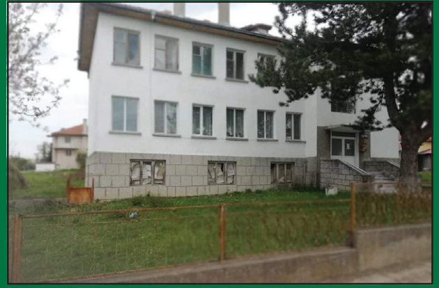
На стр. 4

ОДОБРЕН Е ПРОЕКТЪТ ЗА ИЗГРАЖДАНЕ НА ЦЕНТЪР ЗА СОЦИАЛНИ УСЛУГИ В С.БЕЗМЕР